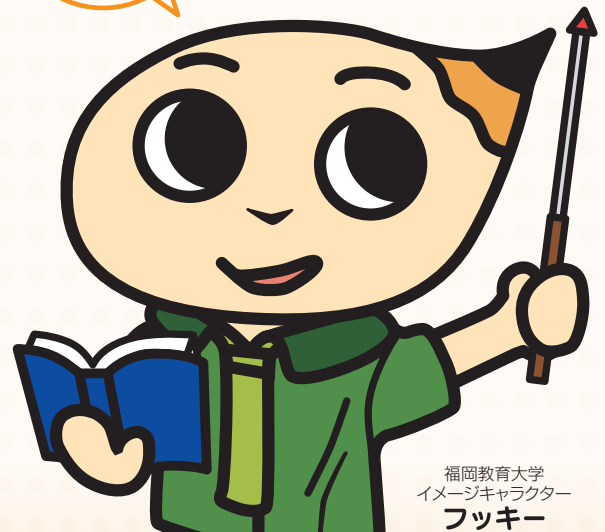
福岡教育大学 イメージキャラクター フッキー

日時 ▶ 平成28年11月13日(日) 場所 ▶ 福岡教育大学 10時～16時 (宗像市赤間文教町1-1)