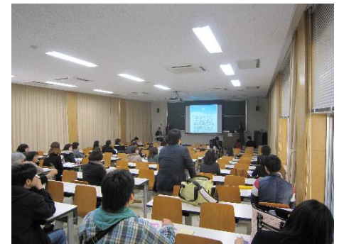
The research presentation